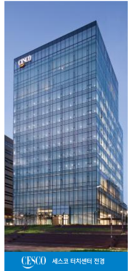
세스코 터치센터 전경